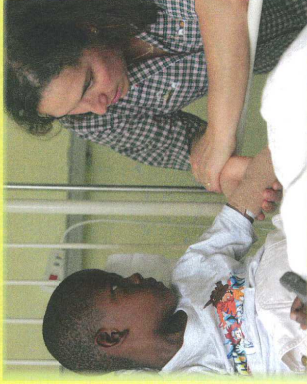
Petit garçon rassuré par « sa maman d'accueil » avant son opération

Il existe aussi des familles d'accueil pour les enfants malades venant d'un pays qui n'a pas les moyens de les soigner. Les enfants sont accueillis le temps de leur opération et de leur rétablissement. Souvent, les enfants ne parlent pas le français mais le regard et les gestes permettent de se comprendre.