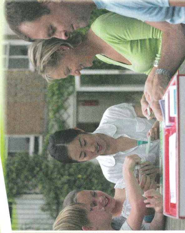
Jeune fille japonaise accueillie dans une famille

Des enfants ou des adolescents peuvent être hébergés par une famille d'accueil lors d'un séjour à l'étranger. La famille prend en charge le logement et les repas de l'enfant. Être en famille d'accueil permet de parler la langue tous les jours et de partager les habitudes des habitants du pays.