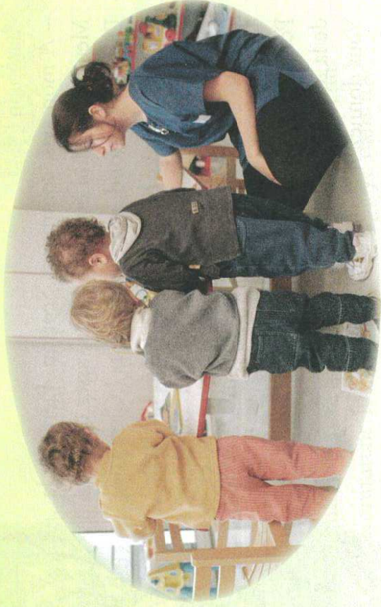
Enfants en attente de placement dans une pouponnière

Avant d'être accueillis par une famille, les tout-petits sont placés dans des pouponnières, les plus grands dans des foyers.